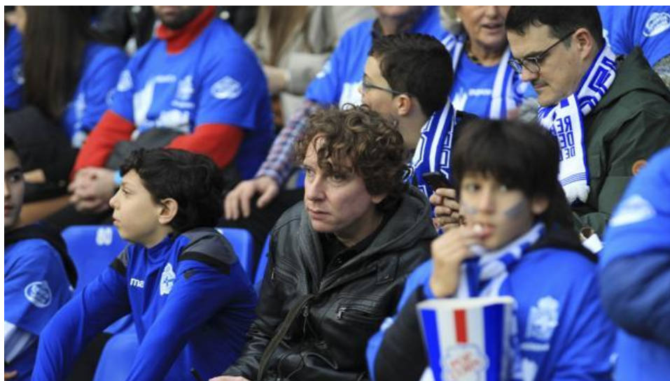
4 Jesús Suárez— crédito: Real Club Deportivo de la Coruña

JS: Hoy en día con el proyecto Escoita 1.0 se trata únicamente de la compra de los dispositivos. Os puedo indicar que la inversión que se ha hecho no ha superado los 6.000 euros, y además los locutores son alumnos de la Universidad de A Coruña del Master de Comunicación Audiovisual.