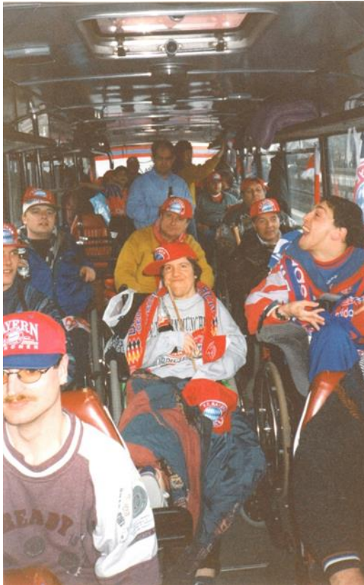
2 Foto del primer partido fuera de casa en Stuttgart en 1996

división e incluso en algunos casos hasta clubes de cuarta división. Desde el año 2014, otro colectivo como los aficionados con discapacidad auditiva de cada club de la Bundesliga, en todos los niveles, se han organizado en una asociación nacional de aficionados con discapacidad auditiva. Registrada como asociación sin ánimo de lucro, esta organización agrupa a expertos y asesora a las ligas, asociaciones y a los propios clubes. Actualmente hay 22 asociaciones con discapacidad auditiva en Alemania, agrupando alrededor de 1.100 miembros.